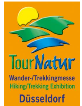
Foto-/Presserundgang: Start in die Wandersaison auf der TourNatur

http://medianet.messe-duesseldorf.de/press/tournatur/main